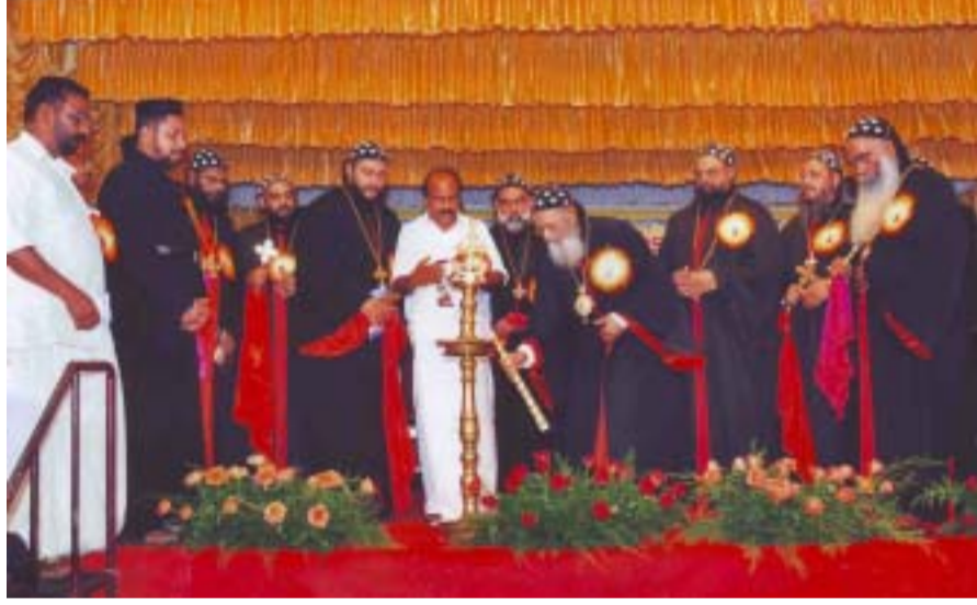
കോലഞ്ചേരി സെന്റ് പീറ്റേഴ്സ് ആൻഡ് സെന്റ് പോൾസ് യാക്കോബായ സുറിയാനി പള്ളിയിൽ കുടുംബയുണിറ്റുകളുടെ സാമൂഹ്യ ശ്രേഷ്ഠ കാത്തോലിക്ക ബസിലിയേയ്ക്ക് തോമസ് പ്രഥമൻ ബാവ ശ്രീഘോഷം ചെയ്യുന്നു.

കോലഞ്ചേരി: ആരാധനാലയങ്ങൾ പൂട്ടിയിടാൻ ആഗ്രഹിക്കുന്നവർ മനുഷ്യത്വമില്ലാത്തവരാണെന്ന് ശ്രേഷ്ഠ കാത്തോലിക്ക ബസിലിയോസ് തോമസ് പ്രഥമൻ ബാവ പറഞ്ഞു. കോലഞ്ചേരി സെന്റ് പീറ്റേഴ്സ് ആൻഡ് സെന്റ് പോൾസ് യാക്കോബായ പള്ളി കുടുംബയുണിറ്റുകളുടെ മഹാസംഗമത്തോടനുബന്ധിച്ചു നടന്ന പൊതു സമ്മേളനം ഉദ്ഘാടനം ചെയ്യുകയായിരുന്നു ബാവ. വിശുദ്ധന്മാർ കബറടങ്ങിയിട്ടുള്ള ദൈവലയങ്ങൾ അടഞ്ഞുകിടക്കാൻ കാരണക്കാരായവർ ദൈവത്വവും മനുഷ്യത്വവും മൃഗീയത്വവും നഷ്ടപ്പെട്ടവരാണ്. കോതമംഗലം പള്ളിയിൽ കയാർത്തെന്നു പറയുന്ന തൃക്കുന്നത്തെ കാവർക്കോർ ആദ്യം അവിടെ നിന്ന് ഇങ്ങിനെണമെന്നും ബാവ പറഞ്ഞു. കോലഞ്ചേരിയുടെ എല്ലാ ഐശ്വര്യങ്ങൾക്കും കാരണമായ പള്ളി പൂട്ടിക്കിടക്കുന്നതിനിടയാക്കിയവർ ഈ പ്രദേശവുമായി ബന്ധമില്ലാത്തവരാണെന്നും ബാവ പറഞ്ഞു.