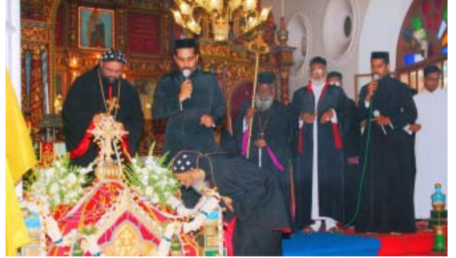
കണ്ടനാട് പള്ളിയിൽ കബറടങ്ങിയിരിക്കുന്ന വി. മോർ ബസേലിയോസ് ശക്രള ബാവായുടെ കബറിൽ ശ്രേഷ്ഠ പിതാവ് മുത്തുന്നു.