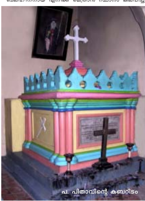
പി. പിതാവുന്റെ കബറിടം

പുൻത്തിയാക്കി ഞാൻ അഭിപ്രത്യ തിരുമേനിയോട് യാത്രപറഞ്ഞു പോന്നപ്പോൾ തിരുമേനി കല്പിച്ചത് “താനൊരു മെത്രാൻ ആകും” എന്നാണ്. പിന്നീട് എന്നെ മെത്രാൻ സ്ഥാനത്തേക്ക് തിരുമേനിയുടെ അടുപ്പം ഈ പഴയകാര്യങ്ങൾ അനുസ്മരിപ്പിച്ചുകൊണ്ടു വന്യു തിരുമേനി ഒരു ആശിർവാദ കല്പന സസ്പന്ദം അയച്ചിരുന്നു. ഞാൻ ഇന്നും ഓർക്കുന്നു.